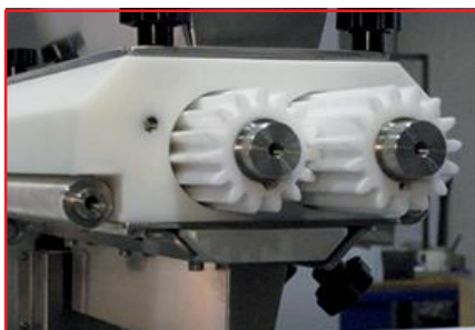
TESTA A POMPA PUMP HEAD TETE A POMPE