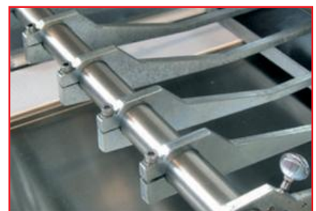
TAGLIO A FILO WIRECUT COUPE A FILE

La nostra politica è di continuo miglioramento e sviluppo. Ci riserviamo quindi il diritto di modificare le informazioni contenute in questo depliant senza nessun preavviso. Our policy is aimed to a constant improvement and development. We therefore reserve the right to amend the information given in this leaflet without prior notice.